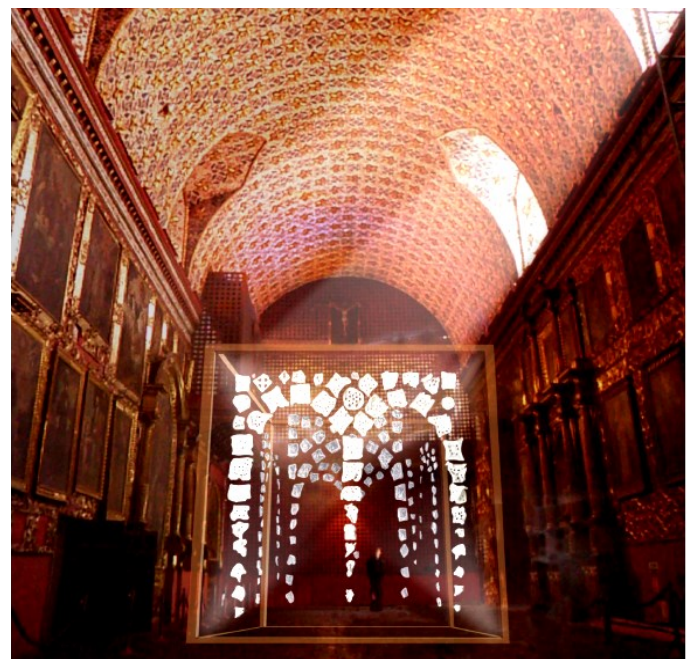
Patio Interior - Museo Santa Clara