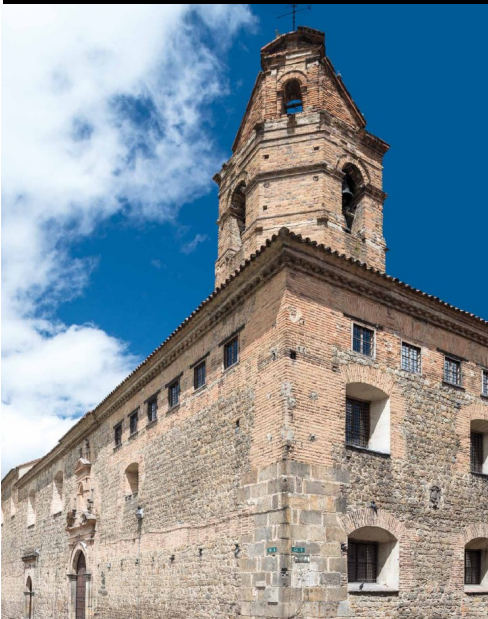
Fachada del Museo Santa Clara